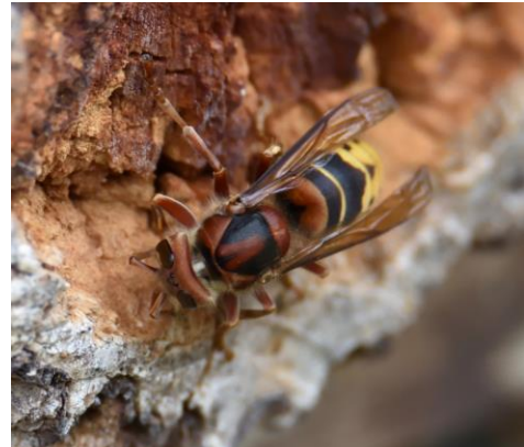
Europäische Hornisse ( Vespa crabro ) beim Abraspeln von morschem Holz, das zum Aufbau des Nestes dient.