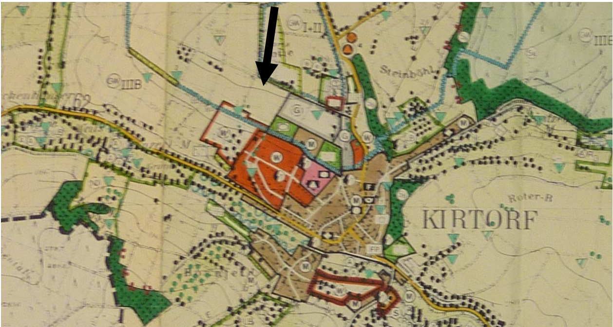
Abb.4: FNP-Darstellung (alt)

Ziel der FNP-Änderung ist die Umwandlung der Fläche für die Landwirtschaft in eine Wohnbaufläche gemäß § 1 Abs.1 Nr.1 BauNVO sowie in eine Ausgleichsfläche gemäß § 5 Abs.2 Nr. 10 BauGB (siehe Pfeil auf Abb. 4).