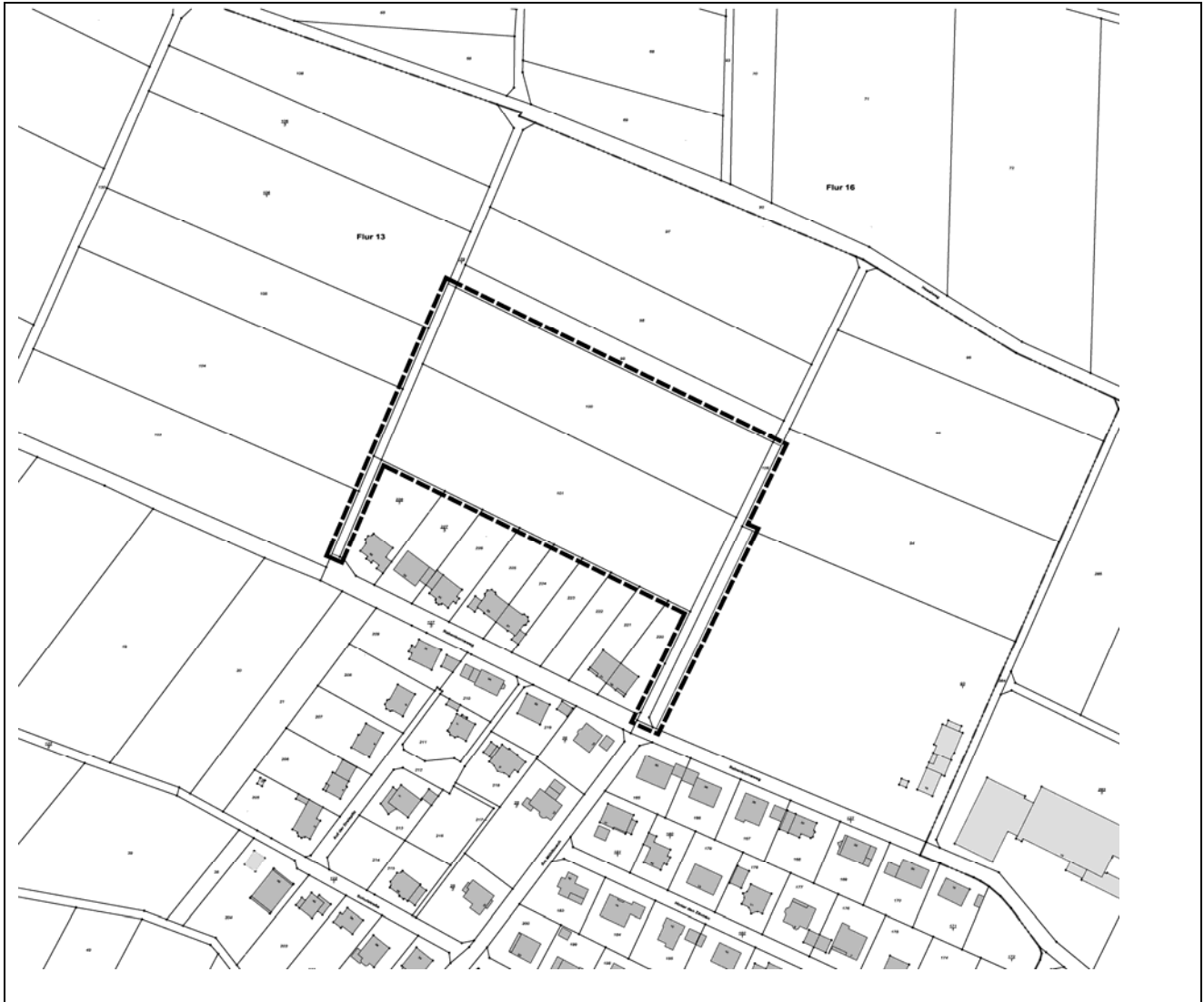
Abb. 1: Übersicht und räumlicher Geltungsbereich des Bebauungsplanes „Heselweg“ (ohne Rücknahme der Wohnbauflächen im Westen)