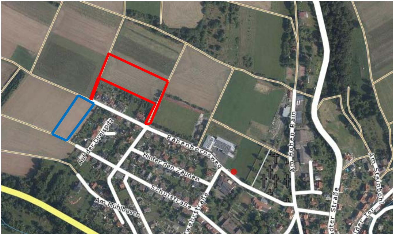
Abb.2: Luftbild des Plangebietes, rot gekennzeichnet, Rücknahme blau gekennzeichnet

Quelle: http://www.geoportal.hessen.de , Stand 14.03.2017